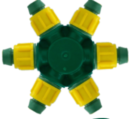
Somunlu Dağıtıcı 6'lı