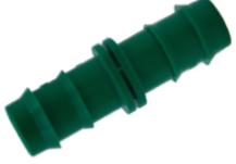
Kurtağı Ekleme Nipeli