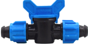
Mini Vana Somunlu