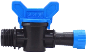
Mini Vana Dış Dişli Yüzlüklü