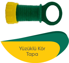
Yüzüklü Kör Tapa