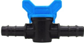
Mini Vana Kurtağı