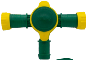
Yusufcuk Conta Çıkışlı Te Vana