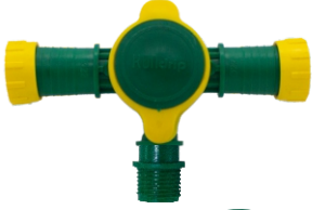
Yusufcuk Dış Dışlı Te Vana