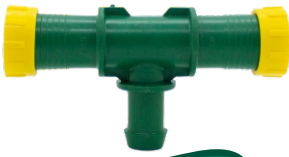
Yüzüklü Çıkış Te