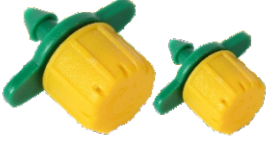
Büyük/Küçük Emitör (Damlatıcı)