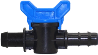
Mini Vana Conta Çıkışlı Kurtağı