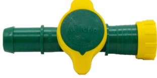
Mini Vana Conta Çıkışlı Yüzüklü