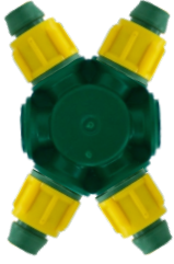
Somunlu Dağıtıcı X