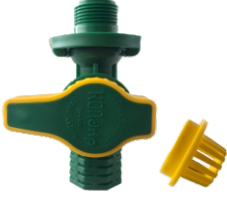
Filtreli Spring Vanası