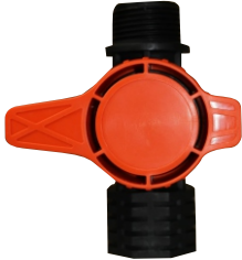
Spring Vanası Sille