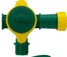
Yusufcuk Dış Dışlı Dirsek Vana