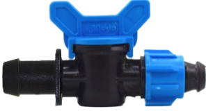
Mini Vana Conta Çıkışlı Somunlu