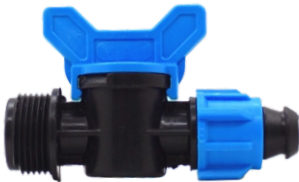
Mini Vana Dış Dışlı Somunlu