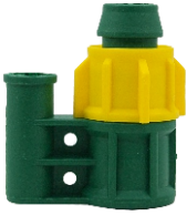
Mini Sprink Bağlantı Adaptörü