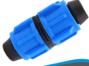
Somunlu Ekleme Nipeli