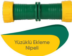
Yüzüklü Ekleme Nipeli