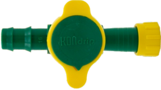
Mini Vana Kurtağzı Yüzüklü