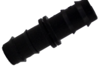
Kurtağzı Ekleme Nipeli