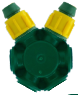
Somunlu Dağıtıcı V