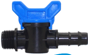
Mini Vana Diş Dişli Kurtağı