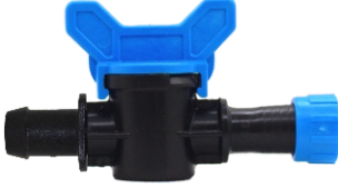
Mini Vana Conta Çıkışlı Yüzlüklü