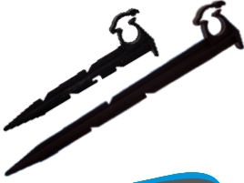
Klipsli Sabitleme Kazığı