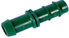
Kurtağı Çıkış Nipeli