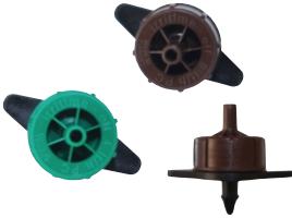
Basınç Ayarlı Hat Üstü Damlatıcı