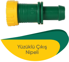
Yüzüklü Çıkış Nipeli