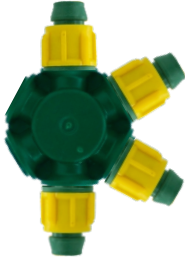
Somunlu Dağıtıcı K