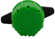
Büyük Emitör Damlatıcı