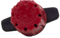
Mini Emitör Damlatıcı