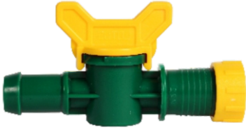
Mini Vana Conta Çıkışlı Yüzüklü