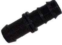
Kurtağzı Çıkış Nipeli