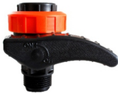
Kaval Vanası Kúpeli