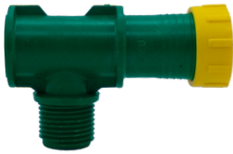
Yüzüklü Dış Dişli Dirsek