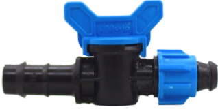
Mini Vana Kurtağzı Somunlu