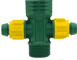
Abot Üstü Istavroz